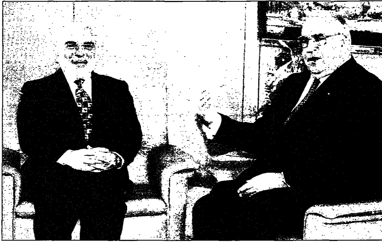
المستشار الثاني يلموت كوي لدى استقباله العامل الأردني في بون أمس

عمان - د. القس العربي: وقد التقى السيد رمضان بالعامل الأردني ونقل إليه هذه الرغبة أثناء توقيفه في عمان وهو في طريقه لحضور قمة للقاء في روما. من جهة أخرى بدأ وزير التجارة العراقي الملك حسين يحمل لواشنطن افكارا للحوار مع العراق ودوره في المنطقة. وكان العراق والأردن قد وقعا قبل شهر على بروتوكول تجاري للمعاملة بقيمة 255 مليون دولار مقارنة مع 220 مليون دولار للمعاملة التي وقعاها الأردن على مفاوضات من أجل التمهيد لتزويد العراق بالبترول والمواد الغذائية والحبوب بموجب مكررة التفاهم للوقت مع الأمم المتحدة.